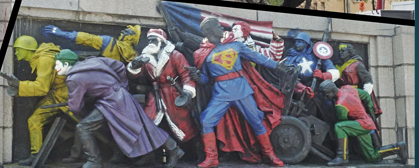
Болгария, София. «Памятник Советской армии». Регулярно подвергается нападению вандалов.