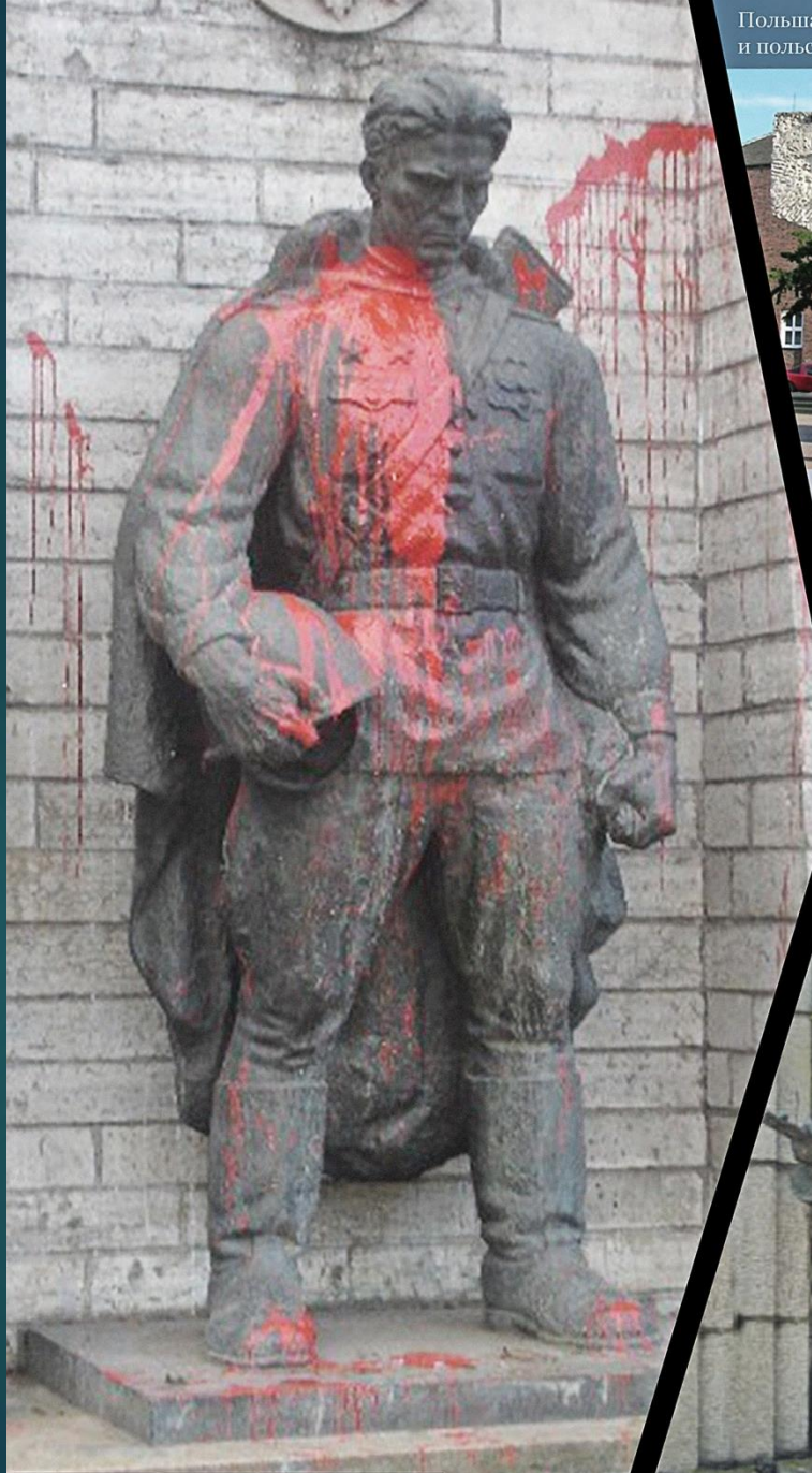
Эстония, Таллин. «Бронзовый солдат». Демонтирован 27 апреля 2007 года.